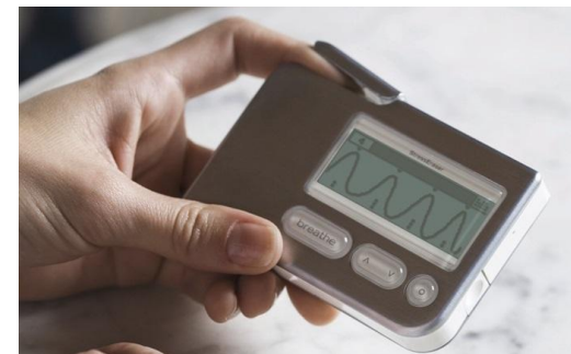
Driedaagse gecertificeerde opleiding